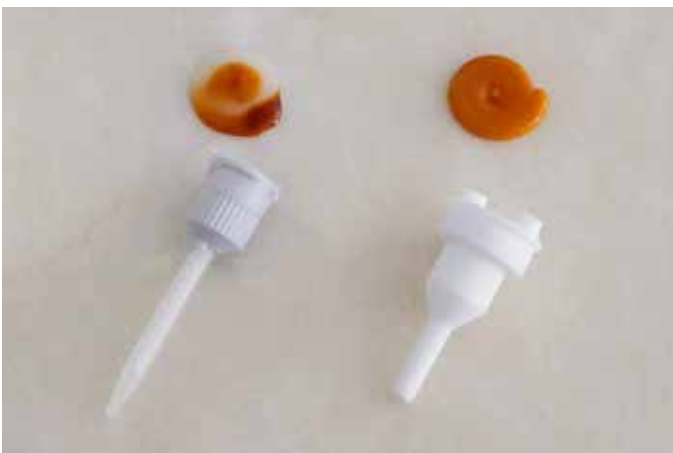
Vergleich: Mischergebnis statische Mischung (links), dynamische Mischung (rechts)

Ergebnis: Der 2-komponentige Epoxid Klebstoff, der per statischer Mischung nicht verarbeitet werden konnte, ist per dynamischer Mischung bereits bei der kleinsten Mischerdrehzahl zuverlässig durchmischt und kann optimal verarbeitet werden.