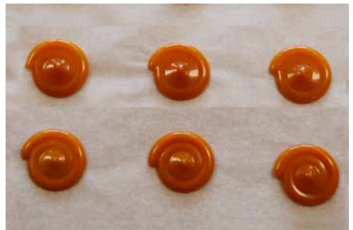
Mischergebnis eco-DUOMIX (dynamische Mischung)